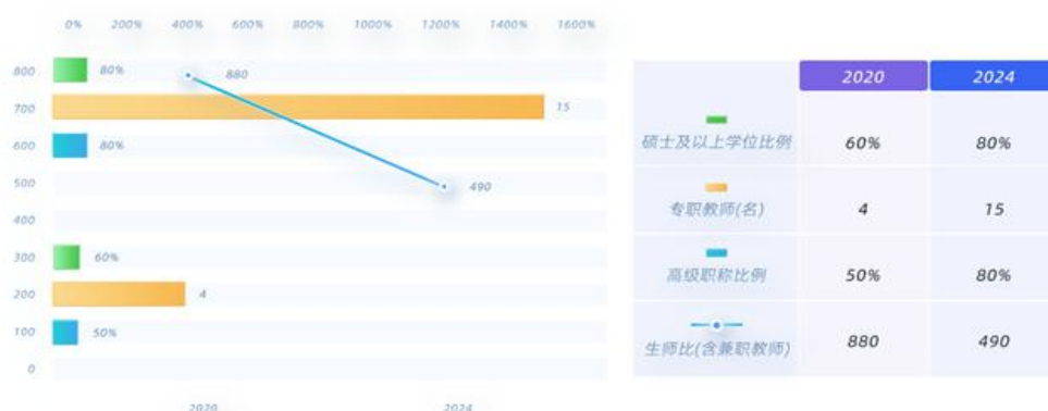
表2：2020—2024年语文类教师教学、科研成果一览表