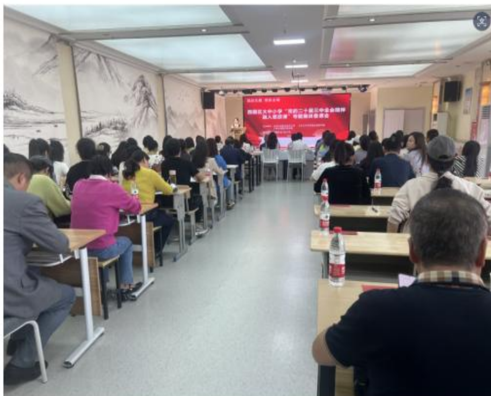
举办西固区大中小学思政课教师集体备课