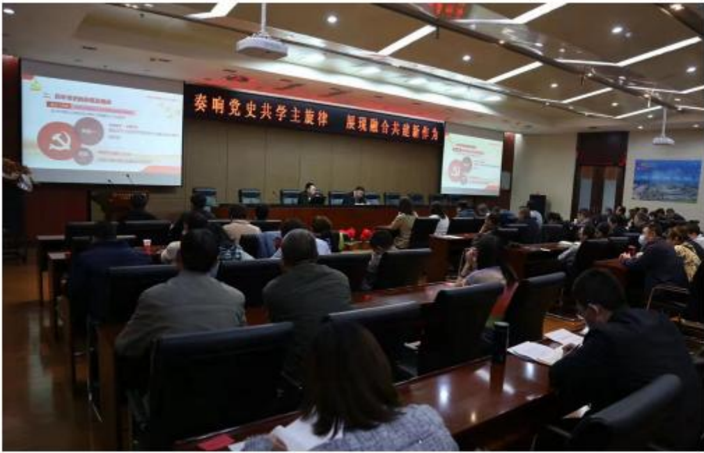
承担西固区大工委培训班培训任务