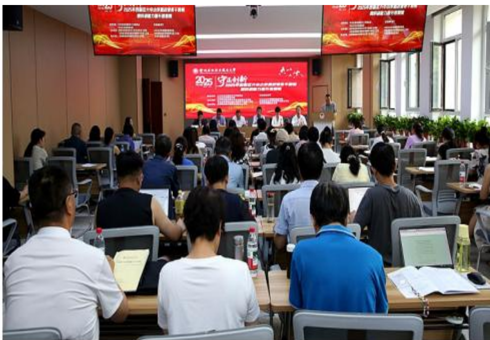
举办西固区大中小学思政课骨干教师培训班