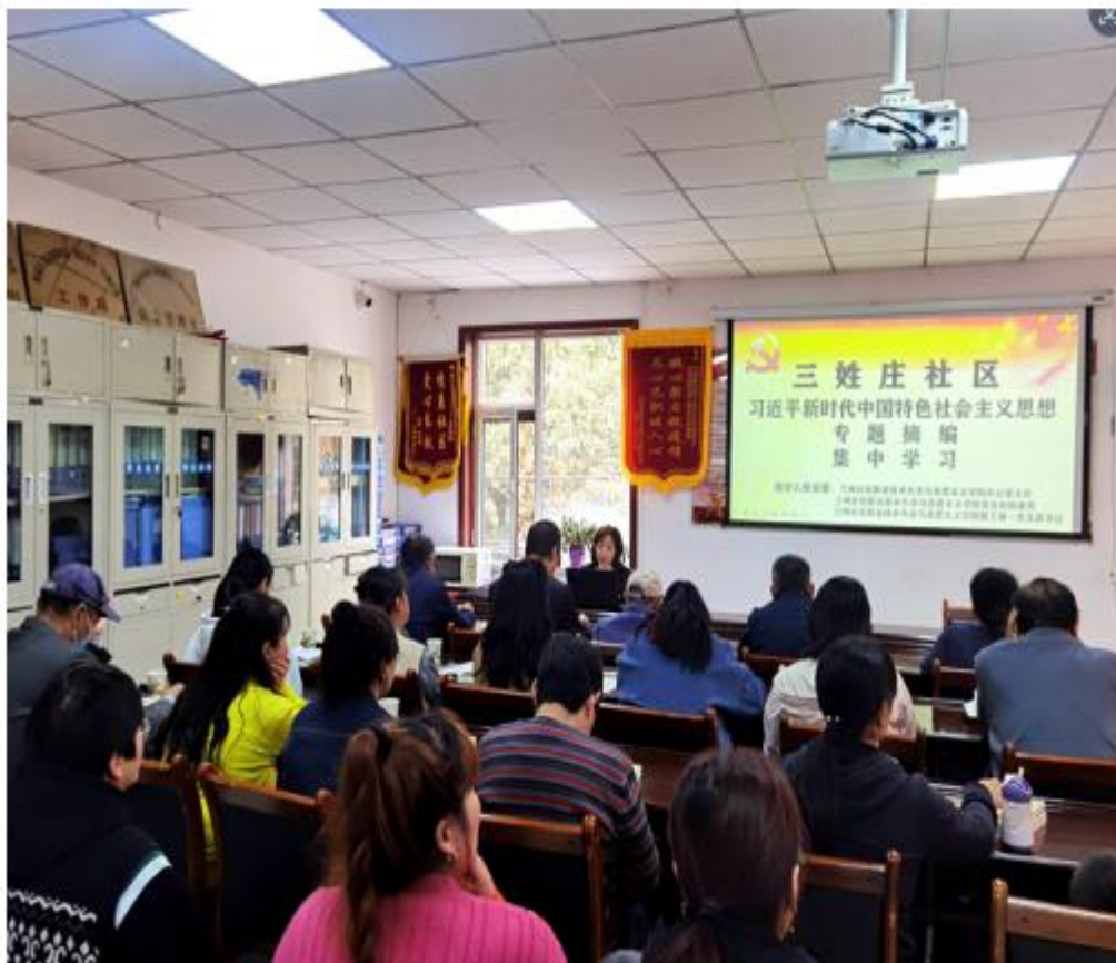
深入西固区社区开展理论宣讲