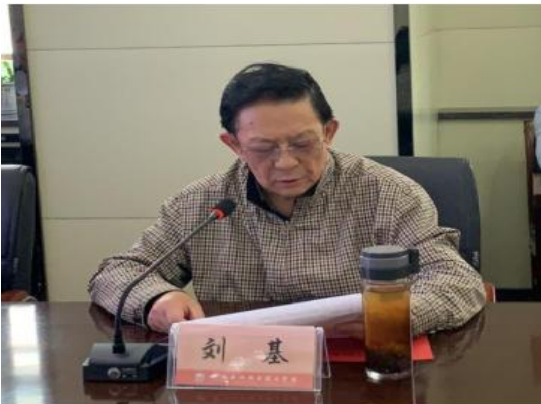
(刘基教授作思政课听课反馈及教学指导)