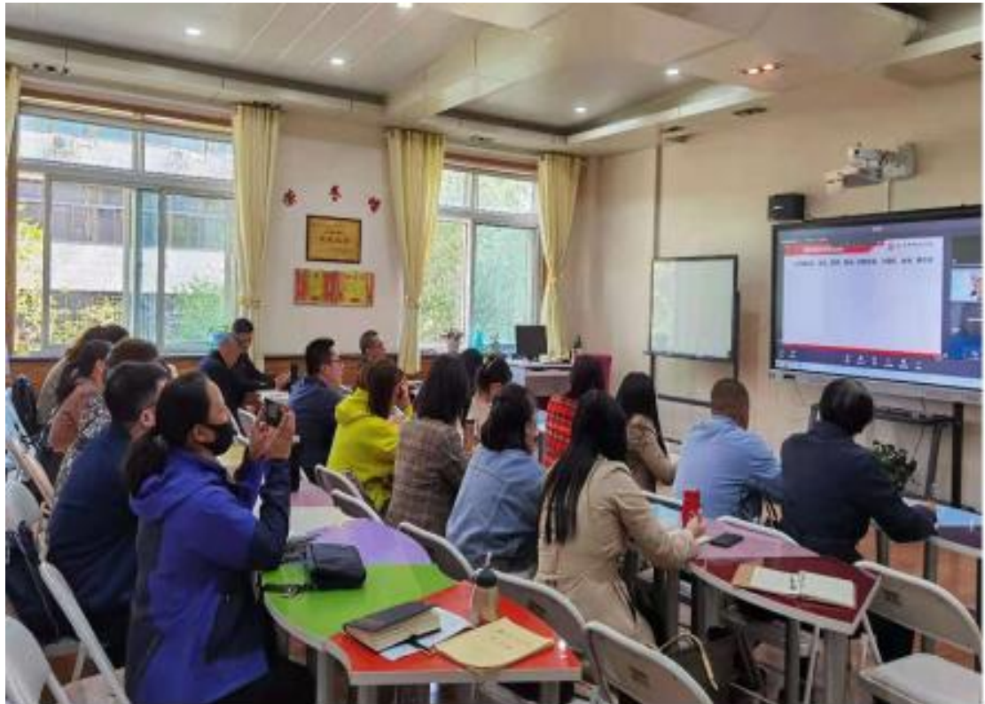
(信息化教学培训研讨现场三)