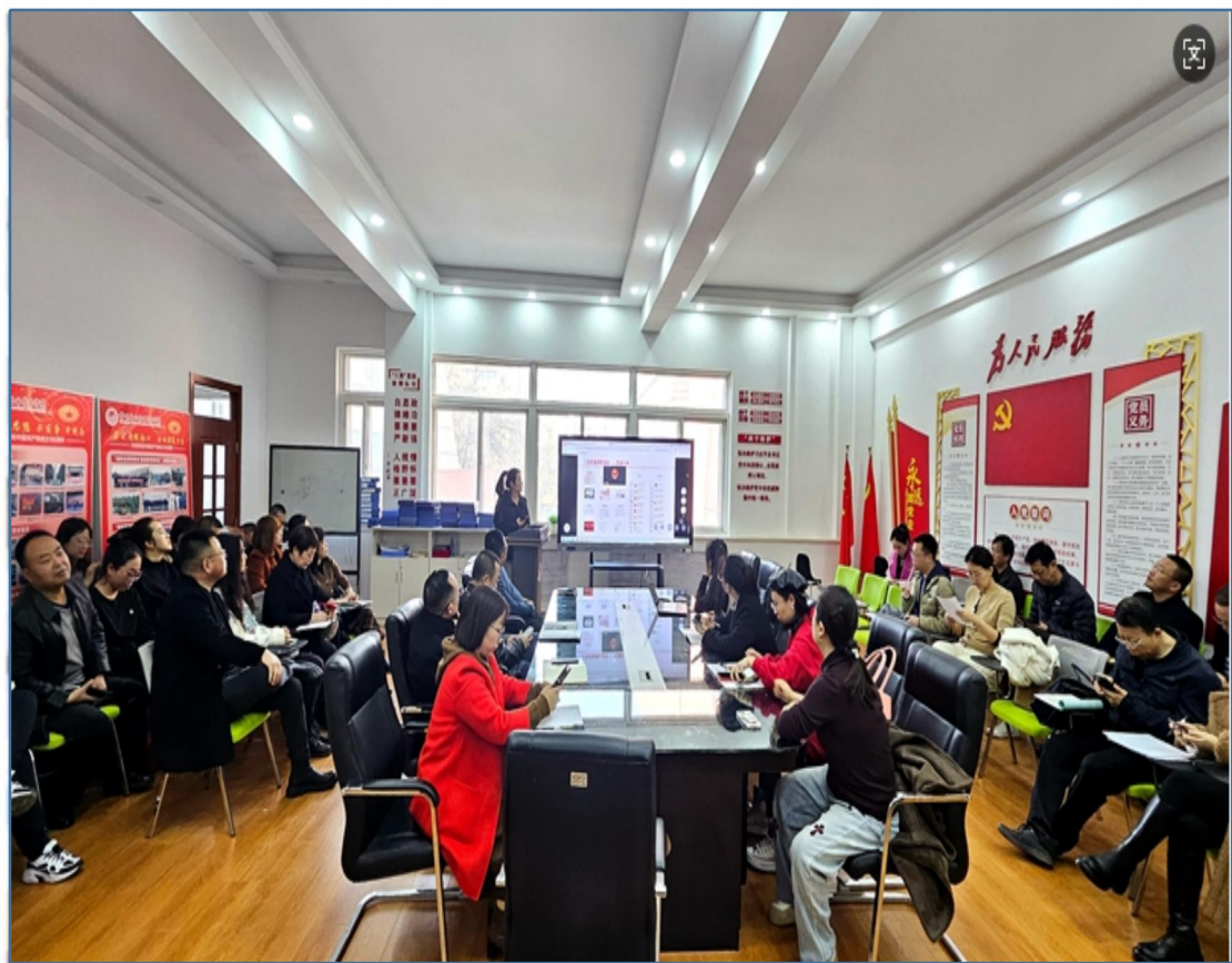
(信息化教学培训研讨现场四)