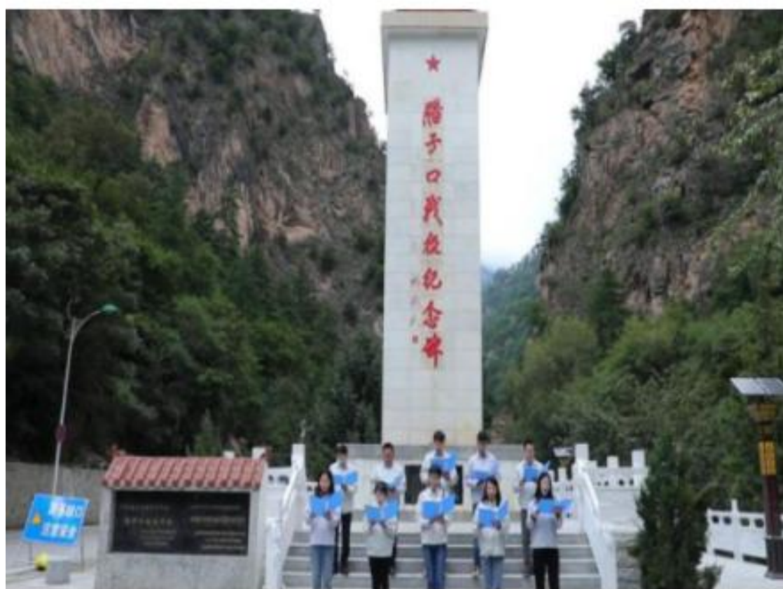
实践研修——追忆先烈事迹