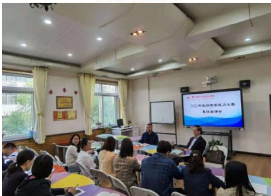
(教学能力大赛集体备课会)