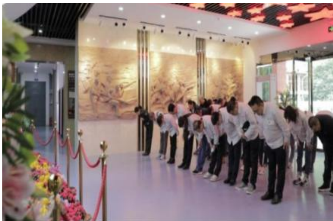
(实践研修——追寻先烈足迹)