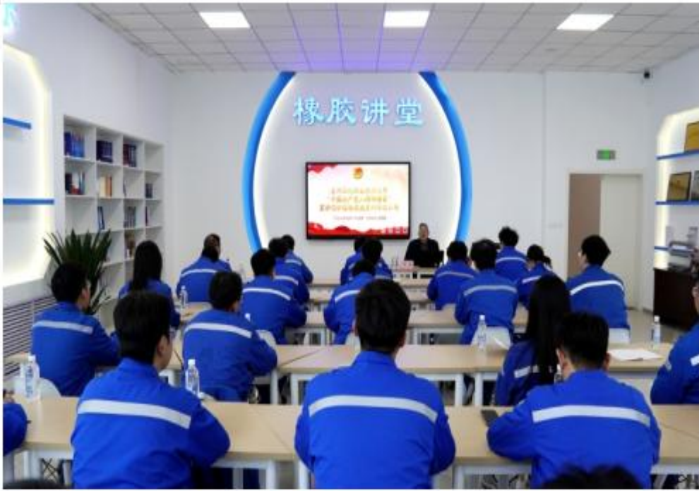
深入兰州石化公司开展理论宣讲