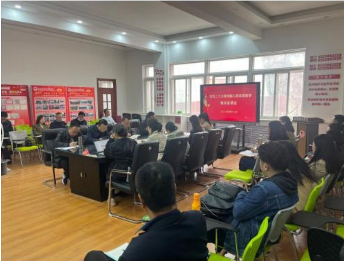
（党的二十大精神融入思政课教学集体备课会）