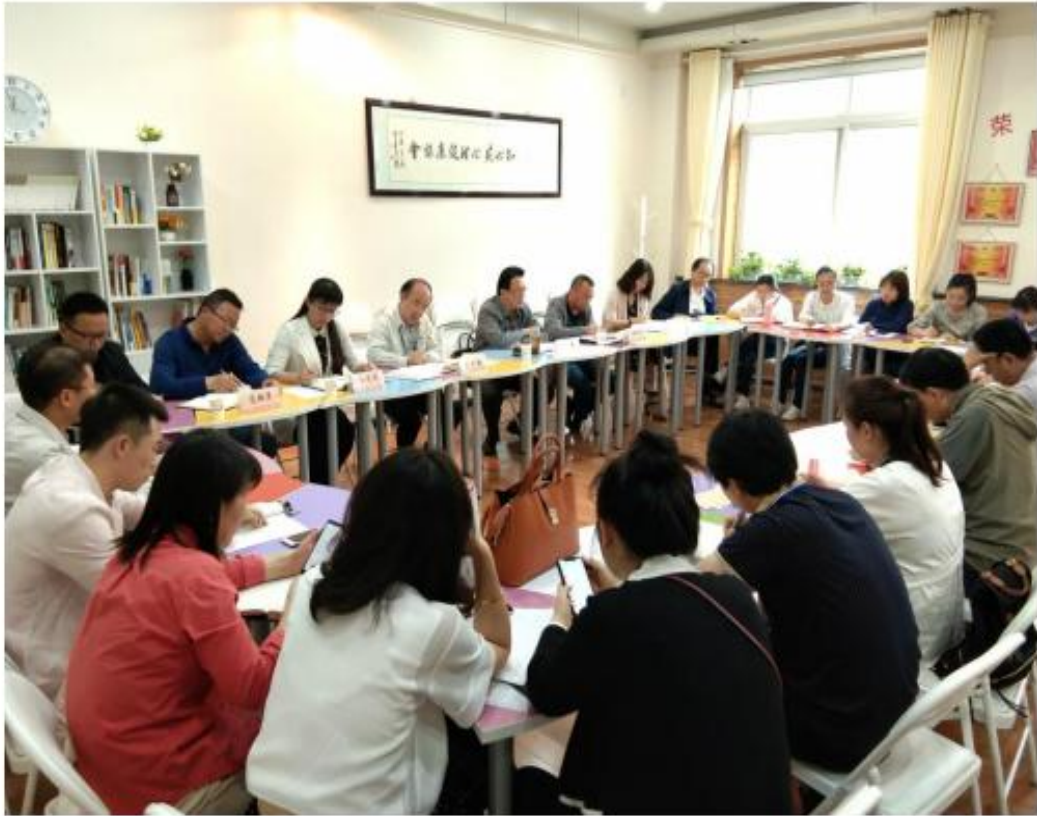
(学校召开思政课教学指导座谈会)