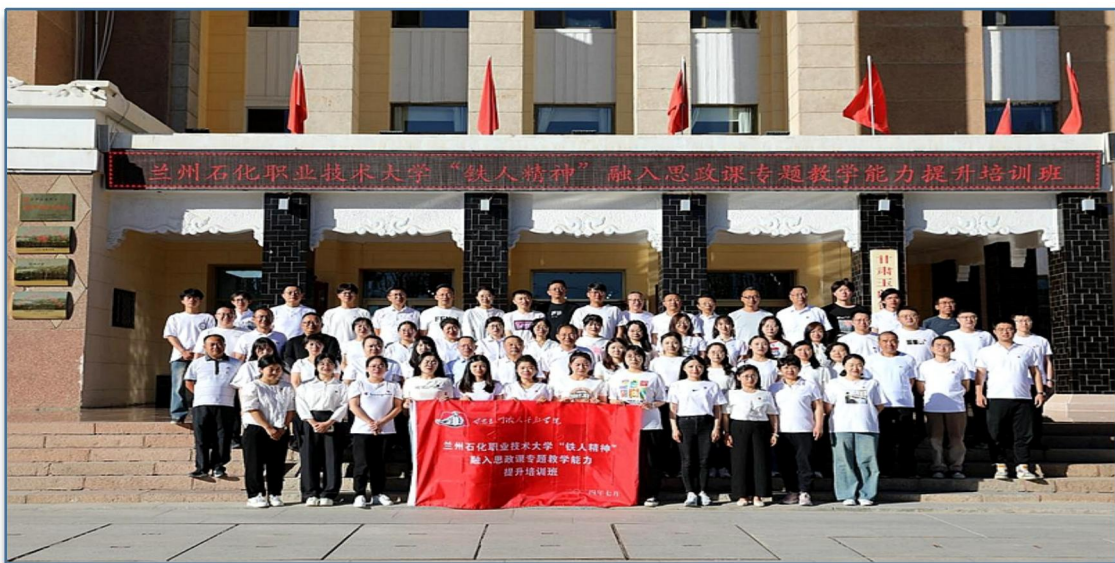
（组织思政课教师赴甘肃铁人干部学院开展培训）