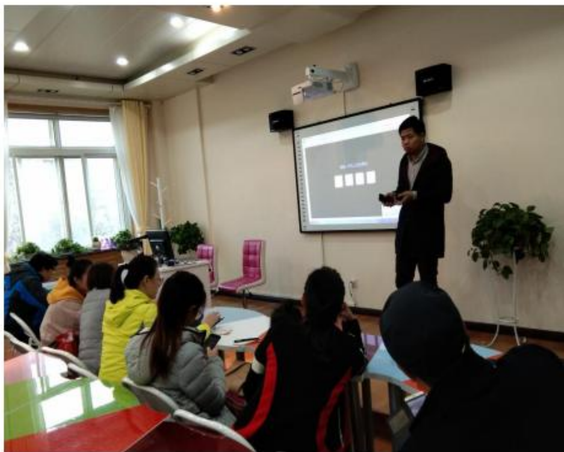
(信息化教学培训研讨现场二)