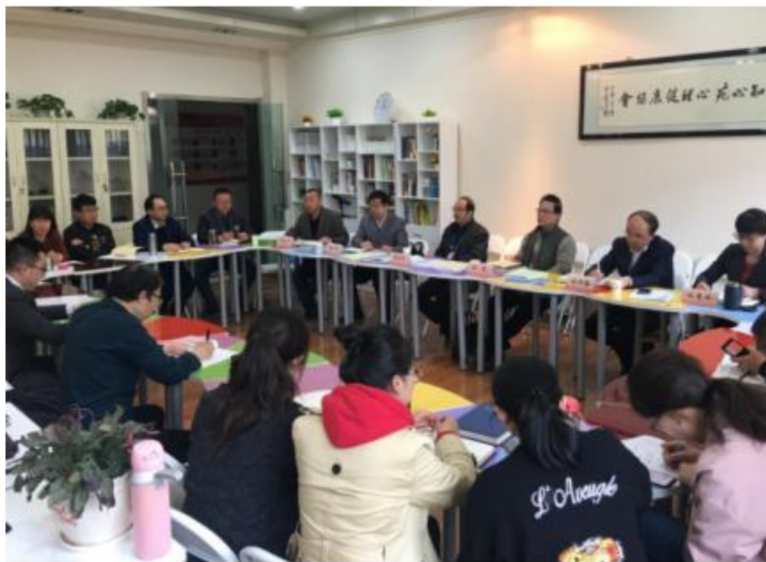
(思政课教学集体备课会)