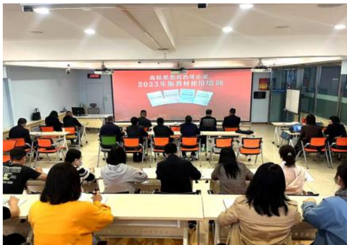
(组织思政课教师参加全国高校思政课 2023 版新教材培训)