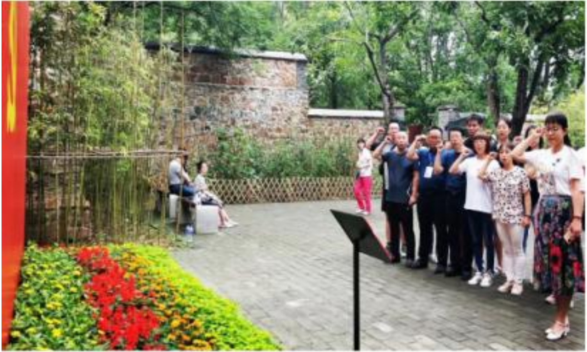
实践研修——重温使命初心