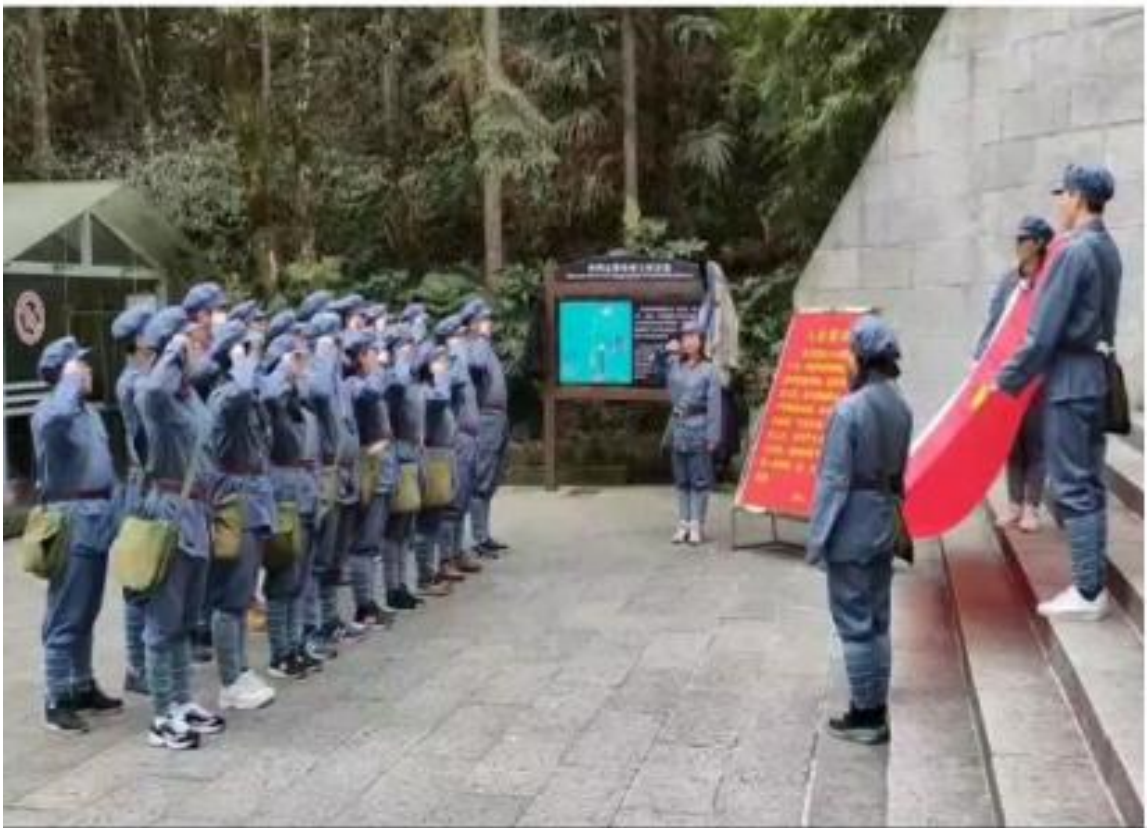
实践研修——重温使命初心