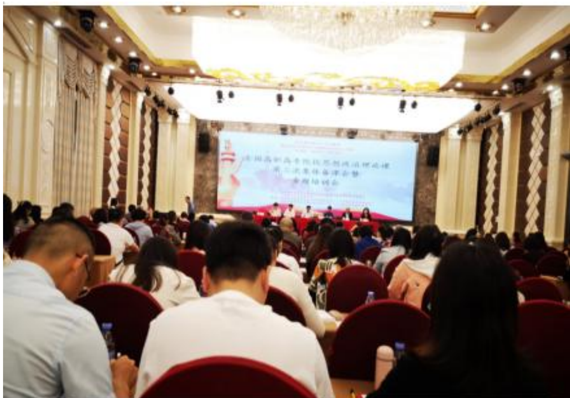
(参加全国高职高专院校思政课建设联盟集体备课专委会第三次集体备课会)