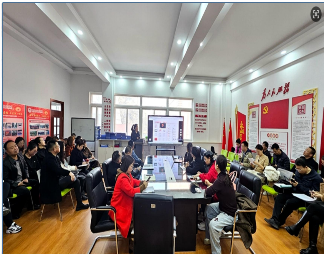
(信息化教学培训研讨现场四)