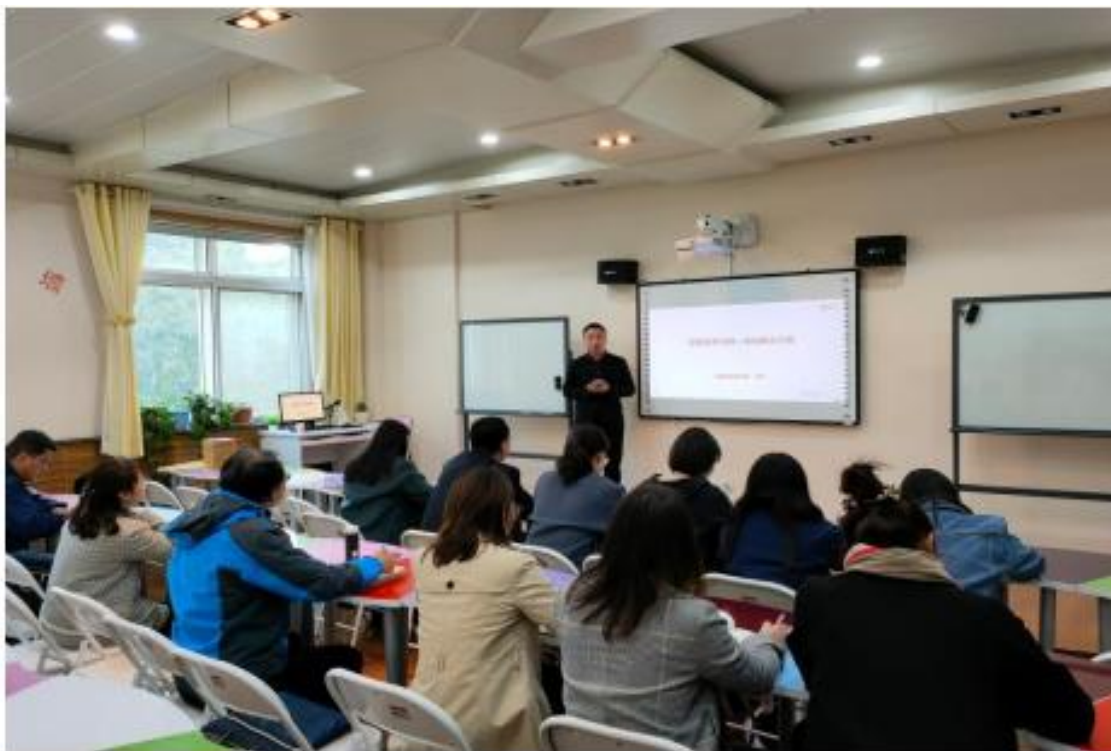
(信息化教学培训研讨现场一)