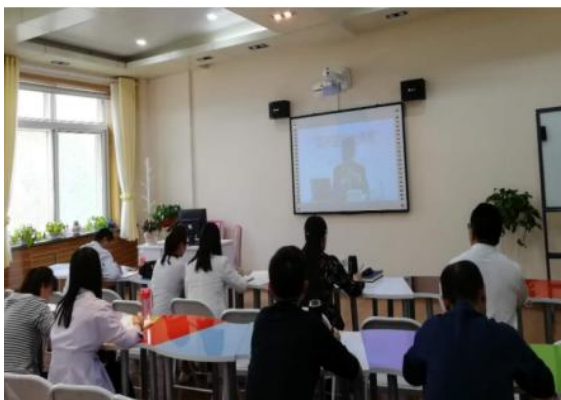
(组织教师在线聆听教育部“周末理论大讲堂”)