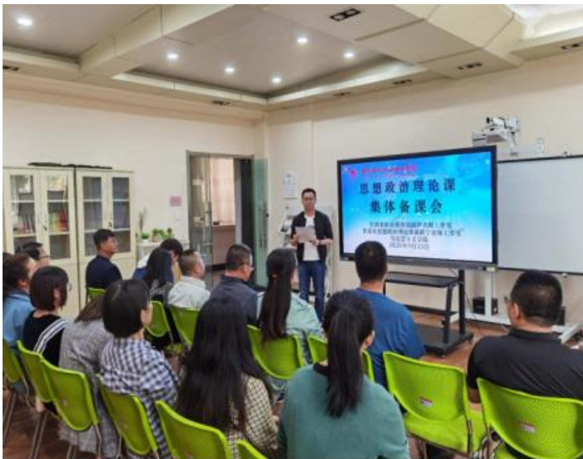
（思想政治理论课集体备课会）