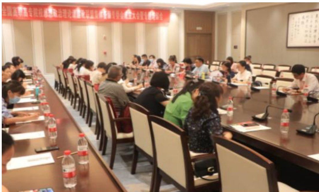
（参加全国高职高专院校思政课建设联盟集体备课专委会第一次集体备课会）

研制并实施《思想政治理论课集体备课制度》，打造常态化集体备课机制，以“主备人示范说课+参备者交流研讨”的方式定期开展思想政治理论课集体备课，切实加强教师的学习交流与合作探究。