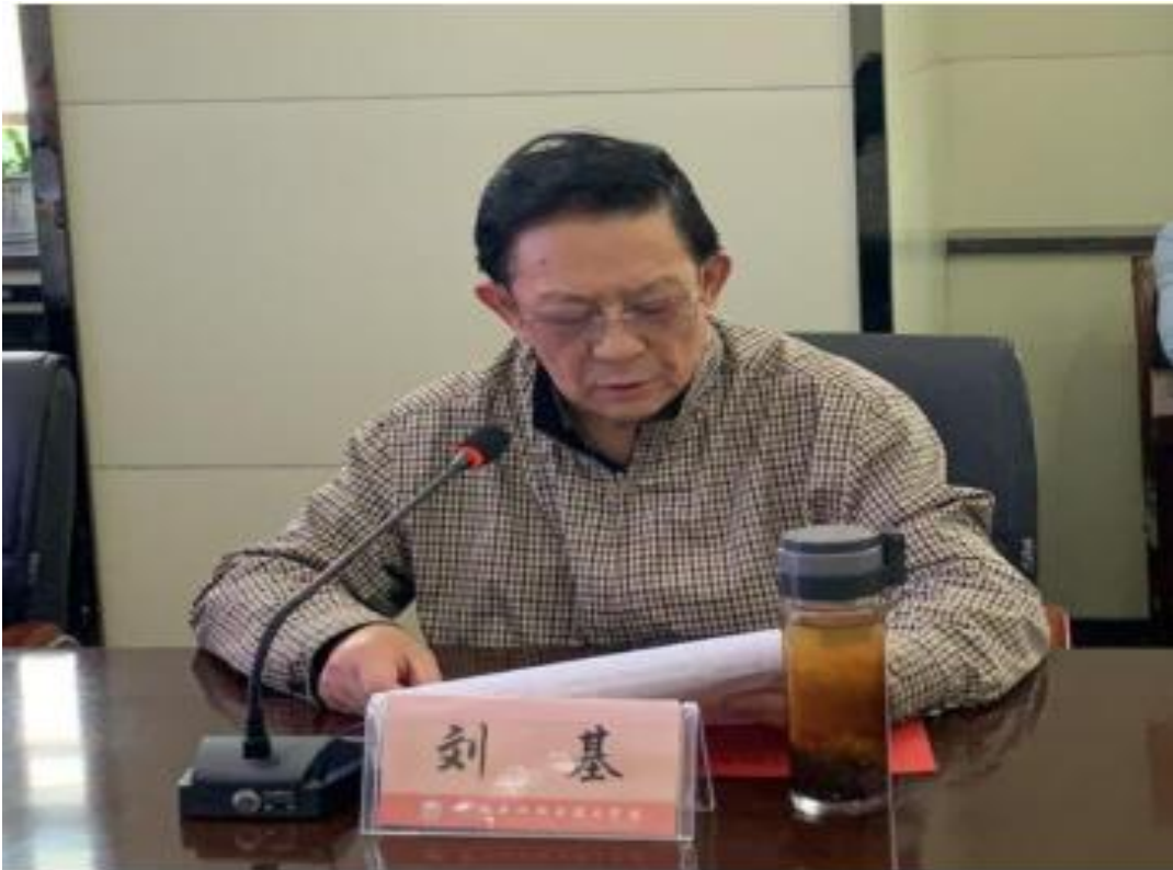
(刘基教授作思政课听课反馈及教学指导)