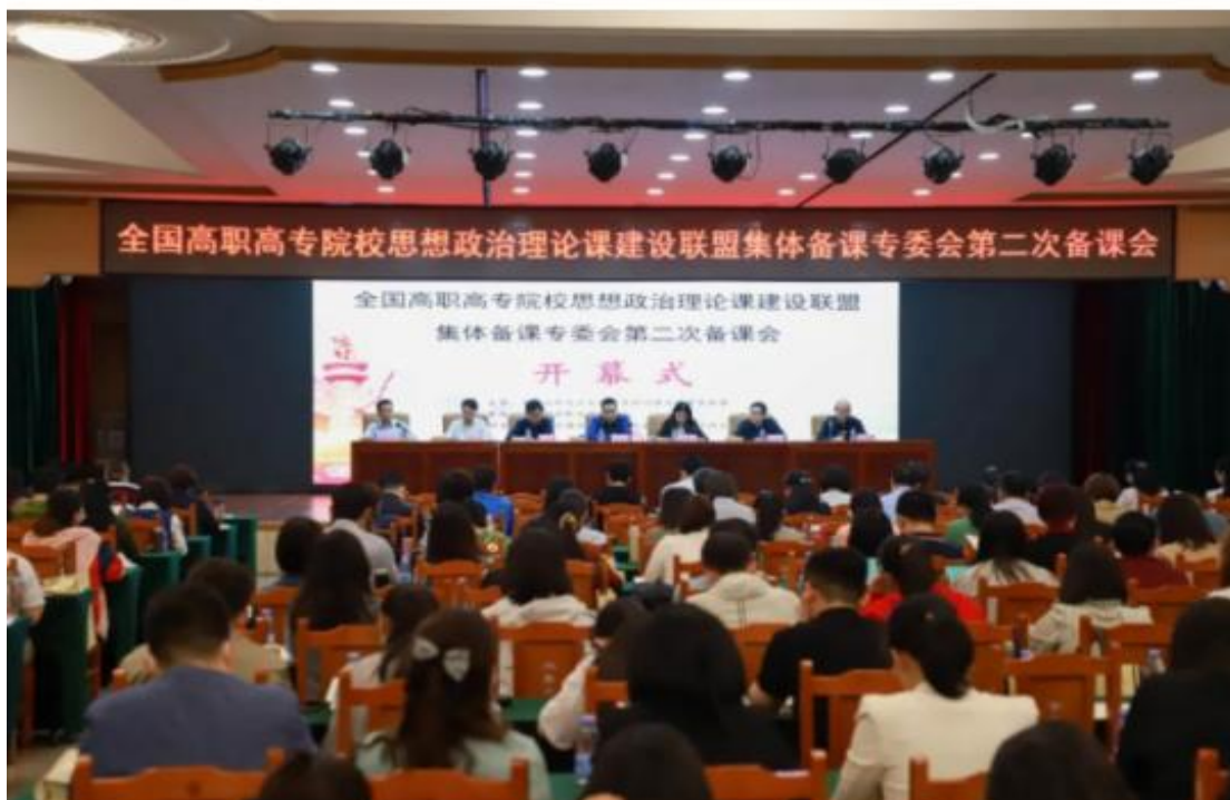
（参加全国高职高专院校思政课建设联盟集体备课专委会第二次集体备课会）