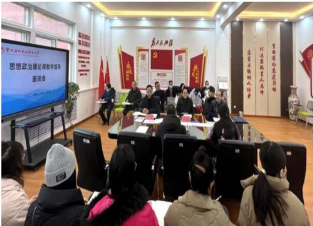
(学校召开思政课教学指导座谈会)