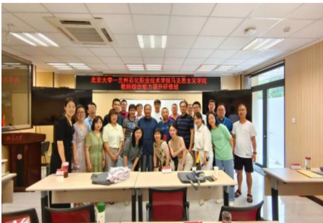
(组织思政课教师赴北京大学开展培训)