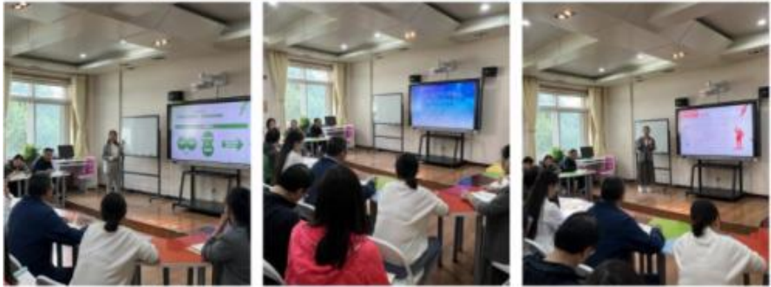
（“十九届六中全会精神融入思政课”专题集体备课会）