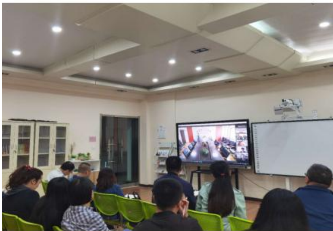
(线上参加甘肃省高校大中小一体化思政课建设集体备课会)