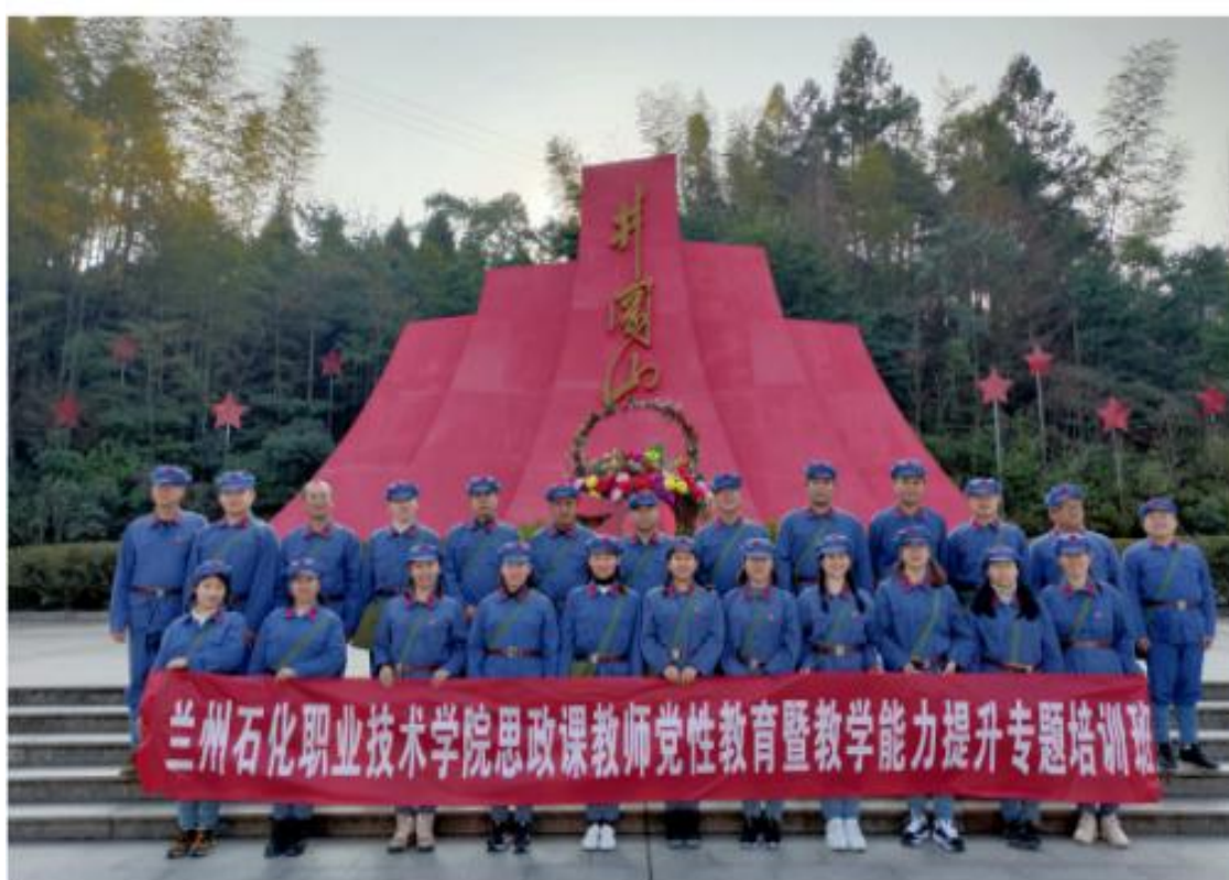
(组织思政课教师赴井冈山干部培训学院开展培训)