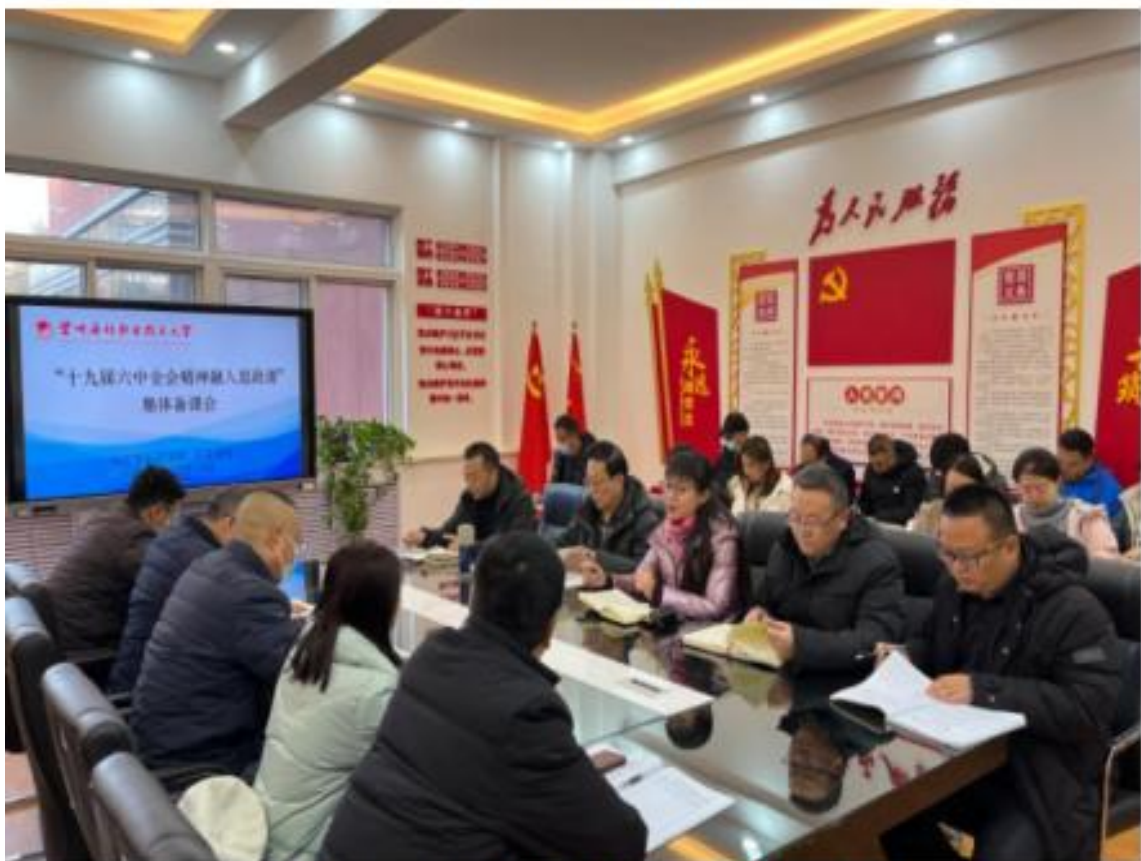
（“十九届六中全会精神融入思政课”专题集体备课会）