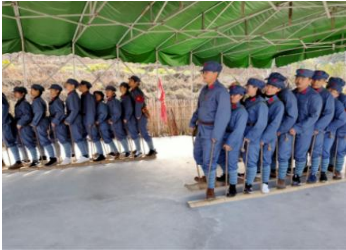
(实践研修——素质拓展训练)