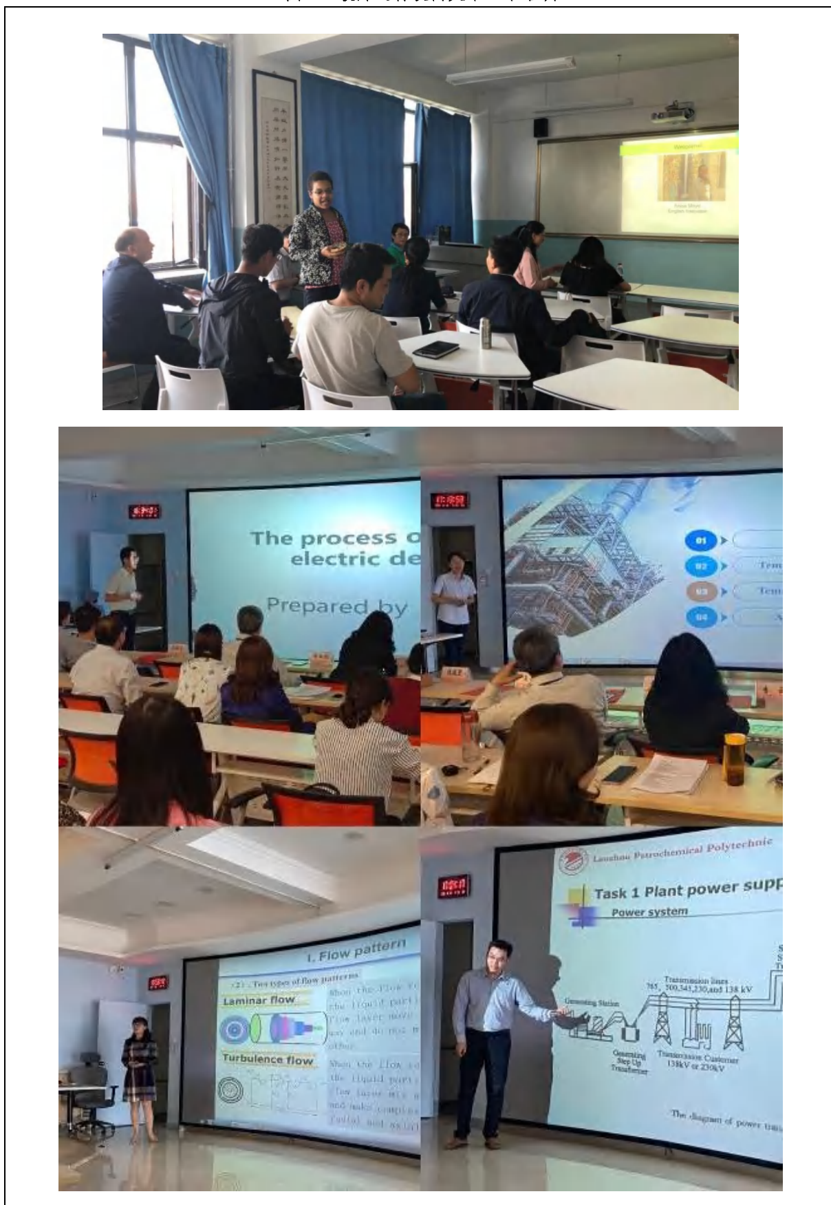
图 10 教师进行校内英语口语培训