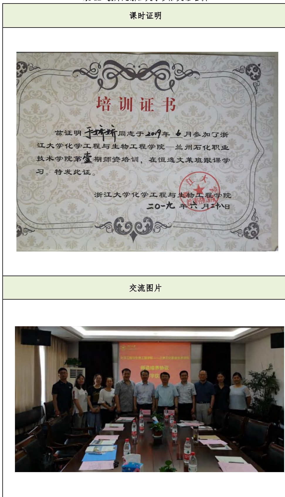
表 12 教师赴浙江大学参加英语培训