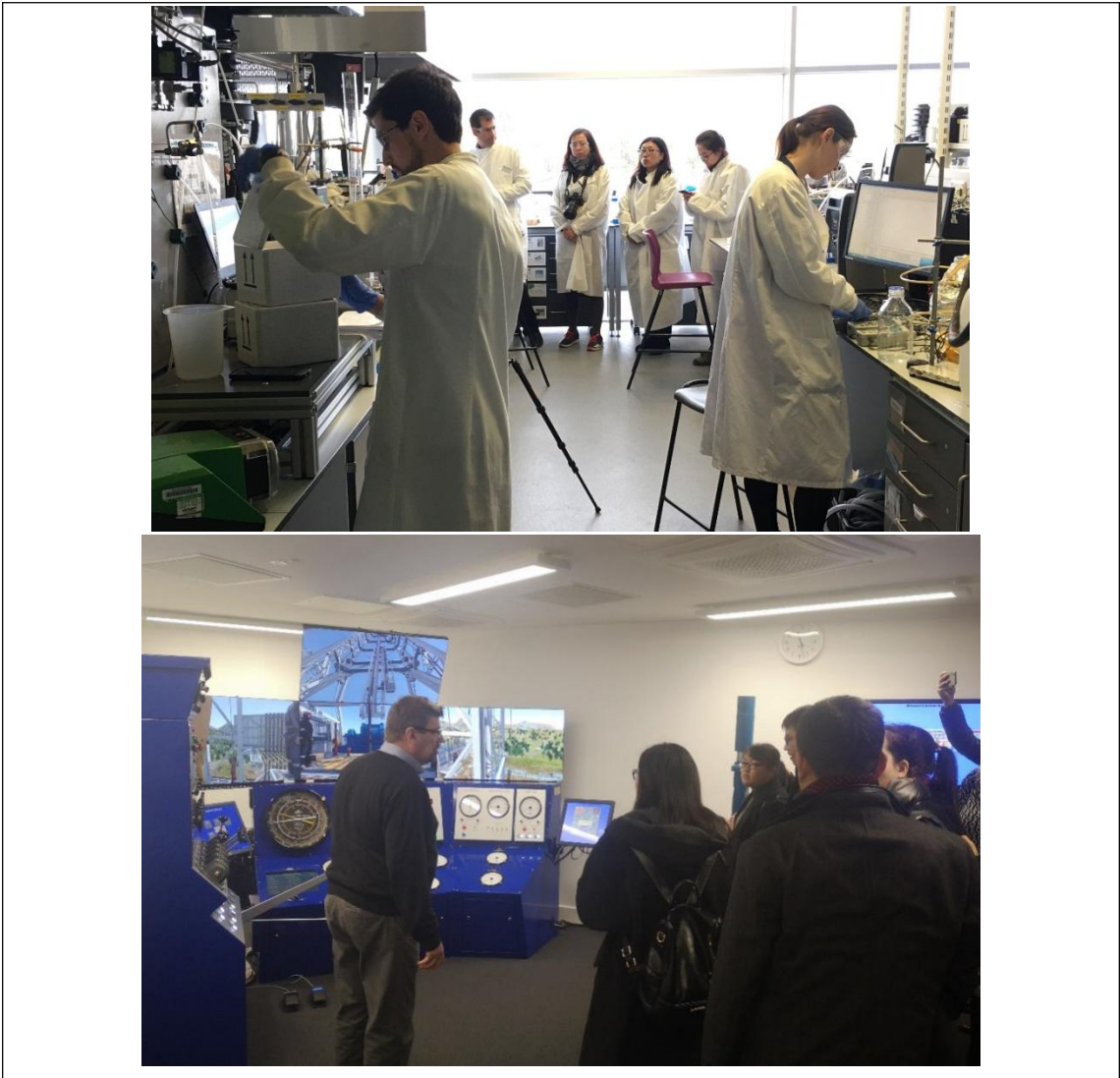
表 7. 教师赴新西兰、澳大利亚参加培训