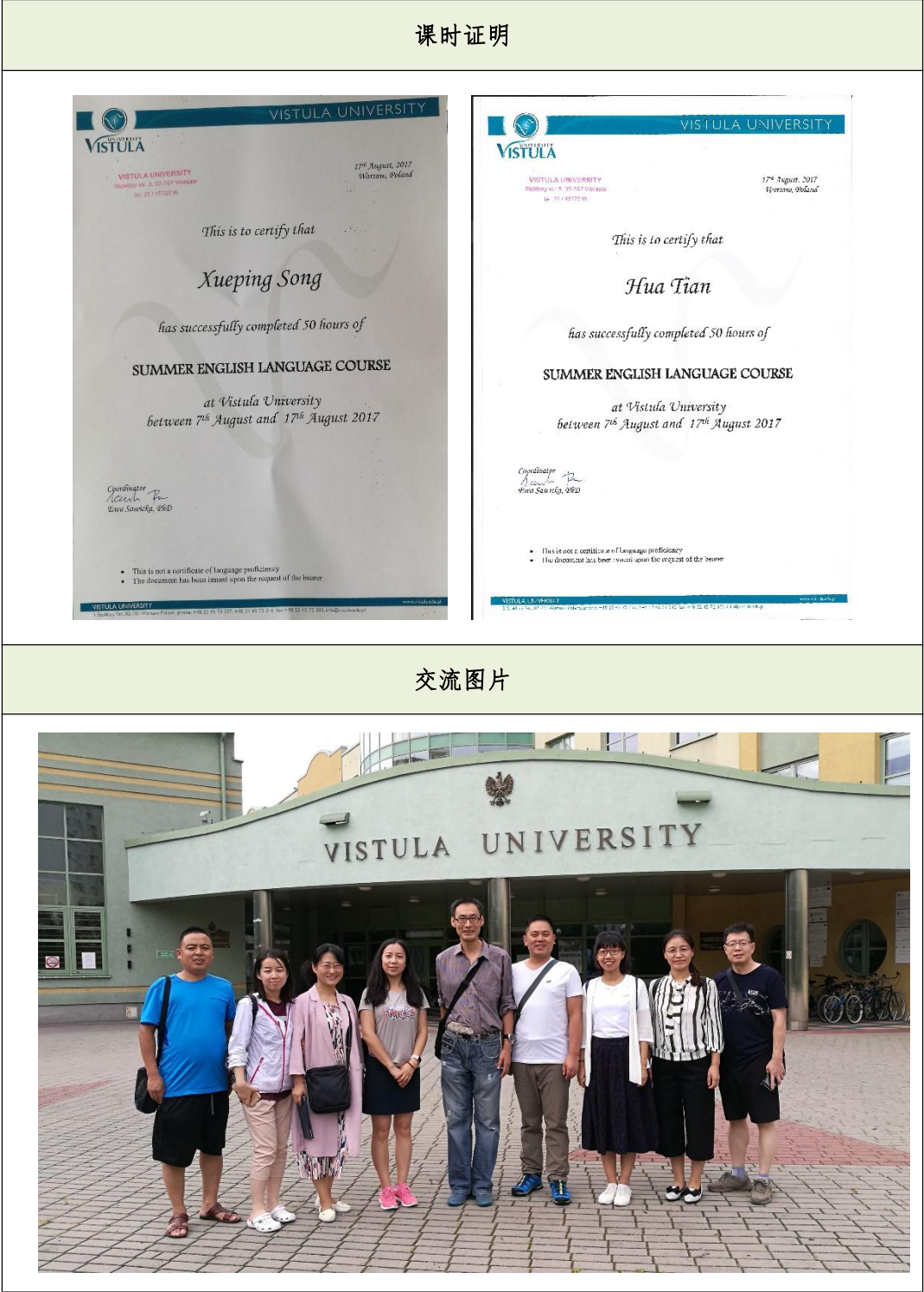
表 5. 教师赴波兰参加英语培训