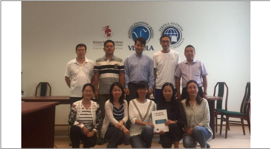
(二) 教师赴英国参加培训交流